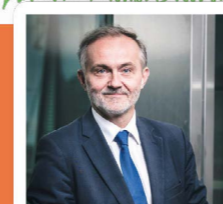
Wojciech Szczurek Prezydent Gdyni