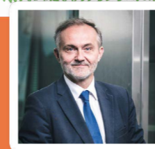
Wojciech Szczurek Prezydent Gdyni