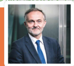
Wojciech Szczurek Prezydent Gdyni