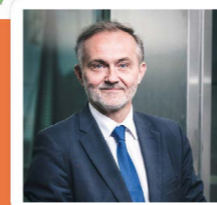
Wojciech Szczurek Prezydent Gdyni