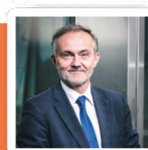
Wojciech Szczurek Prezydent Gdyni