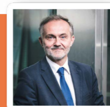
Wojciech Szczurek Prezydent Gdyni