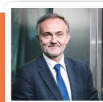
Wojciech Szczurek Prezydent Gdyni