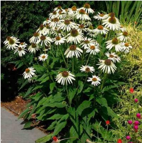
Jeżówka purpurowa 'Alba'