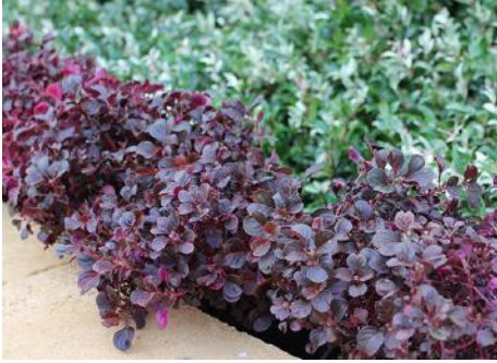
Irezyna odm. Purple Lady